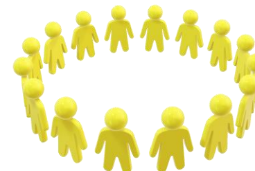
優秀な人材の確保